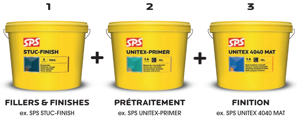
FILLERS & FINISHES ex. SPS STUC-FINISH